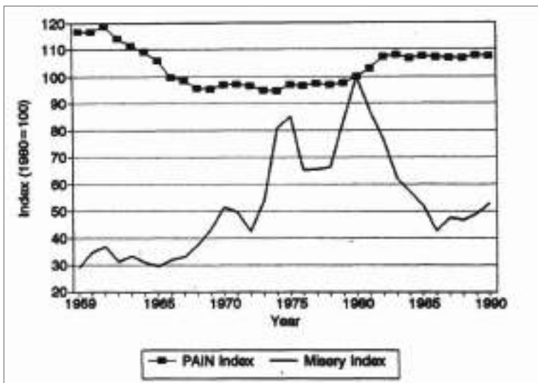
تصویر ۲۰۴: .. رابطه معکوس شاخص رنج (فقر و نابرابری) با شاخص فلاکت در ایالات متحده آمریکا بین سال‌های ۱۹۵۹ تا ۱۹۹۰ میلادی

در پژوهشی که پس از رأی آوردن بیل کلینتون و چهارساله شدن دولت بوش پدر، در دانشگاه ایلانوا انجام گرفت اعلام شد که به علت سیاست‌های غلط اقتصادی جمهوری خواه‌ها برای مهار تورم و بیکاری، رابطهٔ شاخص فلاکت و شاخص رنج (Pain index) ۱ در ایالات متحده، رابطه‌ای معکوس است. نمودار زیر به وضوح نشان می‌دهد در ایالات متحده آمریکا، کاهش شاخص فلاکت با افزایش فقر و نابرابری همراه بوده است.