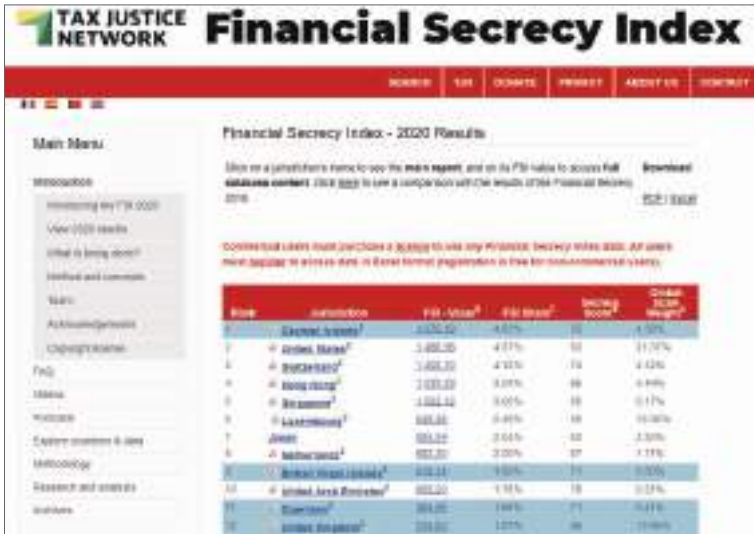
تصویر ۲۰۸: ... رتبه بندی کشورهای جهان براساس شاخص پنهان کاری مالی (FSI)

با توجه به موارد فوق، فساد غیردولتی یکی از مهم ترین حوزه هایی است که باید در محاسبه میزان فساد، مورد توجه قرار گیرد، اما در محاسبه شاخص ادراک فساد، فقط فساد دولتی مورد توجه قرار گرفته است و فقط بر دریافت کننده تمرکز شده است. در صورت محاسبه موارد فوق، فساد مقامات حکومتی کشورهای در حال توسعه نسبت به کل فساد در جهان رقم ناچیزی است. ۱ به گزارش سازمان ملل، میزان فساد در جهان، بایک برآورد حداقلی، ۳٫۶ تریلیون دلار است. ۲